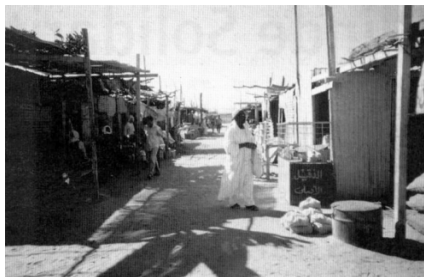
Markt in Wadi Halfa (Nordsudan)

Es wird einerseits in den internationalen Medien bzw. Debatten über Völkermord, ethnische Säuberung und Vergewaltigung von Frauen berichtet, andererseits spricht die Regierung von internationalen Interventionen bzw. Strategien gegen den Sudan, um das Land aufzusplittern. Die Regierung gibt nicht zu, dass Vergewaltigungen als Kriegswaffe eingesetzt werden.