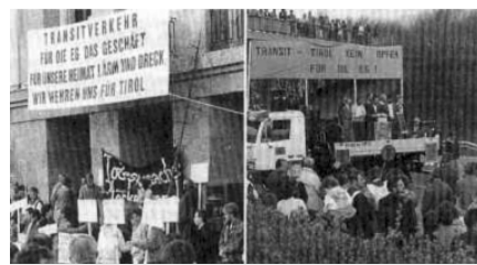
Bilder des Widerstands 5:

Wäre es da nicht einfacher (der Europäische Wirtschaftsraum [EWR] ermöglicht es ja angeblich, sich seinen Arbeitsplatz überall frei zu wählen), die Regierung suchte sich irgendwo in Europa ein neues Volk?